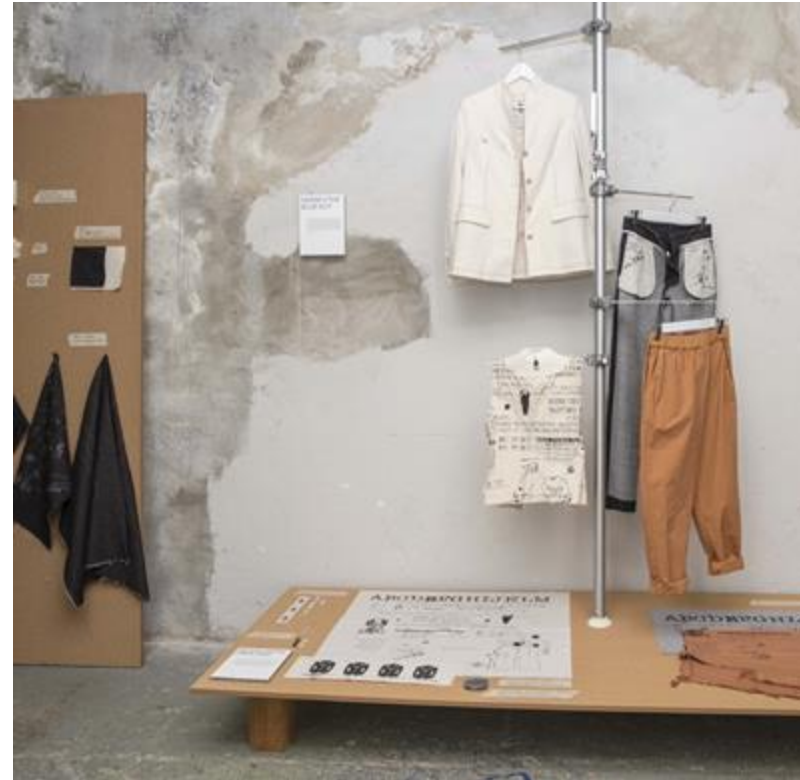
THE BLUE SUIT